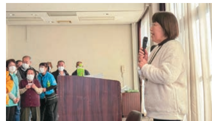
▲多数の参加者が交流を深めました