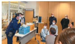
▲フードパントリー(食材配布会)の様子