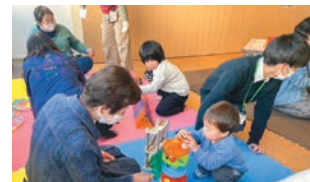
▲託児ブースでは参加団体が子どもの見守りを実施