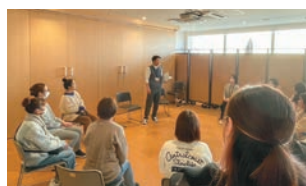
▲座談会でのスピーチタイム

[お問合せ] 荒尾市社会福祉協議会 地域福祉プラットフォーム委員会 TEL 0968-66-2993 FAX 0968-66-2994