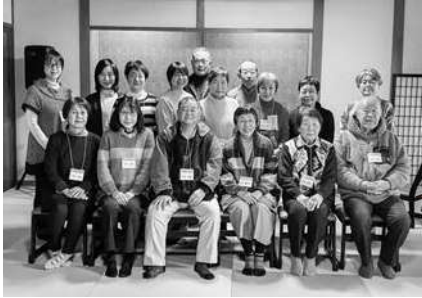
朗読ボランティアグループ「朗読サークルあらお」より一言