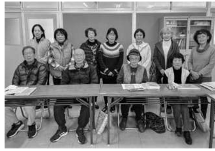
点字ボランティアグループ「点字サークルともしび」より一言

パソコンはあるけど使う機会が少ない方、時間に余裕がある方、コツコツ学ぶのが好きな方にオススメのボランティアです！