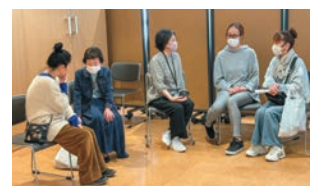
▲座談会では専門職が質問にその場で回答