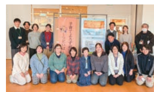
▲ご協力いただいたプラットフォーム参加団体の皆さん