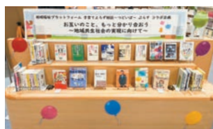
▲図書館に設置した特設ブース