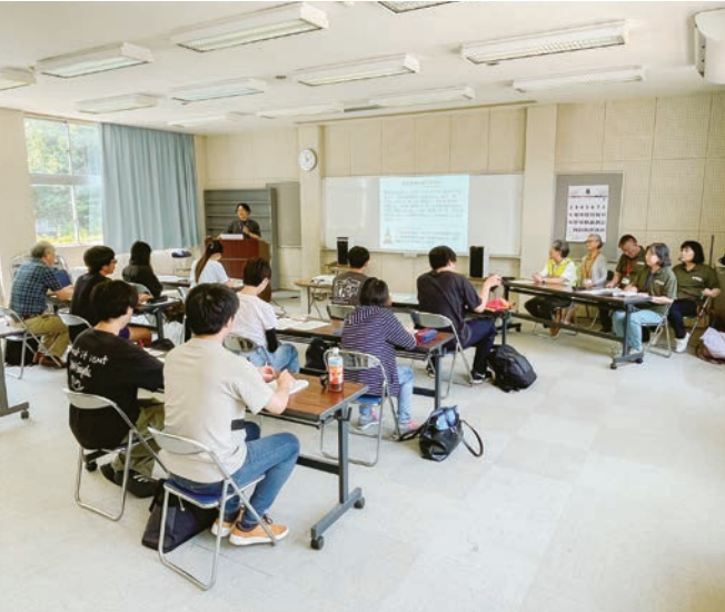
▲民生委員による講義の様子

当日は、学生たちも積極的に質問するなど、新たな気づきや学びが得られた様子でした。