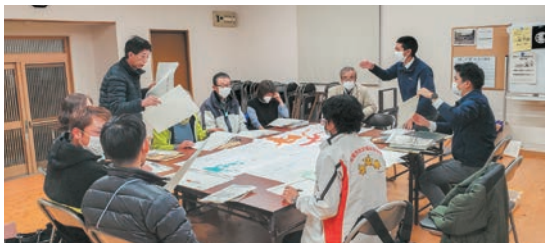
▲榊区では、地域住民やオレンジヒル小岱が協力して見守りマップを作成し、個別計画とのマッチングを行いました。

もしもの災害時、個別計画に基づいて、見守り協力者が高齢者や障がい者などを避難所まで誘導するなどの、ささえあいによる避難行動が図られるよう、荒尾市社会福祉協議会では荒尾市と連携して「ふだんの見守り活動」とのマッチングを推進してまいります。