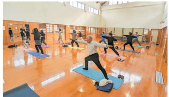
※(注1)概ね60歳以上の活動的な方々のこと

開催日時 令和6年1月～3月の毎週火曜日 午後1時30分～午後3時(全12回) 開催場所 地域産業交流支援館 小岱工芸館 対象者 荒尾市在住のおおむね65歳以上の方 内容 ヨガ運動、各種講話、健康チェック 参加費 2,000円 持参物 水分補給の飲み物、タオル、動きやすい服装、ヨガマット