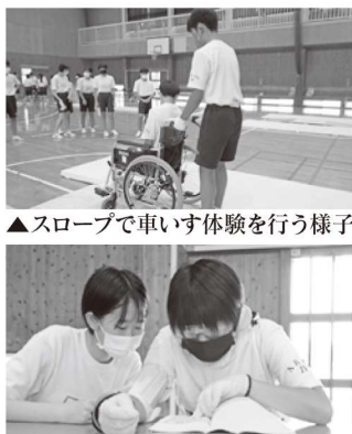
▲スロープで車いす体験を行う様子