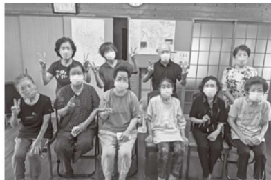
▲深瀬丘区の皆さん

貯筋体操に取り組まれてきた深瀬丘区の皆さんが7月25日に修了式を迎えました。今後も皆さんの活動が継続できるよう社協からも支援を行ってまいります。