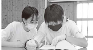
▲視覚・聴覚障がい体験の様子