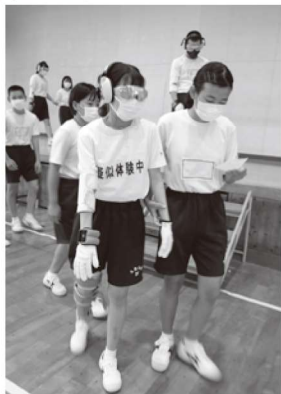
▲高齢者疑似体験の様子

7月13日から15日にかけての3日間、荒尾第四中学校の3年生に福祉体験学習として「車いす体験」、「高齢者疑似体験」を実施しました。参加した学生からは「車いすの操作がこんなに難しいとは思わなかった」「高齢者の不自由さや気持ちが分かった」といった声が寄せられました。荒尾市社協では未来の福祉人材育成のため、これからも福祉体験学習に取り組めます。