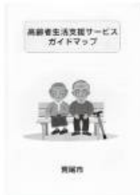
△前回作成のガイドマップ