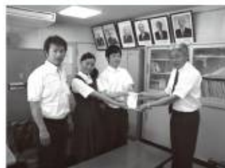
荒尾高校からも寄付