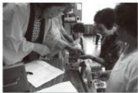
△買物支援の販売会も盛況でした！

6月19日（水）猫宮サロンにおいて夕食サロンと買物支援の取り組みを実施されました。今回はまず、レクリエーションで楽しんだ後、買い物支援の販売会を行い、最後に映画「佐賀のがばいばあちゃん」を見ながら、みんなで夕食をとられました。今回の夕食サロンの取り組みはひとり暮らし高齢者が公民館で一緒に夕食を食べることで、この日だけでも孤食を回避してもらいたいという地域の方の熱い思いから行われました。猫宮の皆さんご協力ありがとうございました。