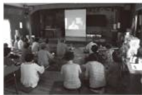
△映画を観ながら夕食を食べました