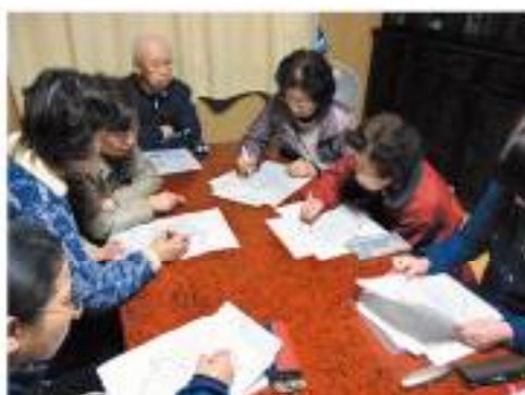
△深瀬ヶ丘区 見守り活動話し合いの真っ最中！地域の要援護者見守りマップを作成しています