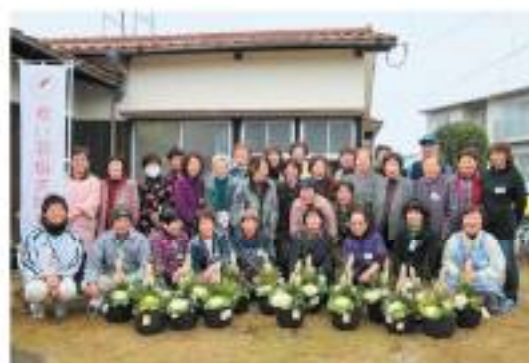
△地域の交流の場、サロン活動 新町サロン歳末たすけあいでお正月寄せ極えをされました