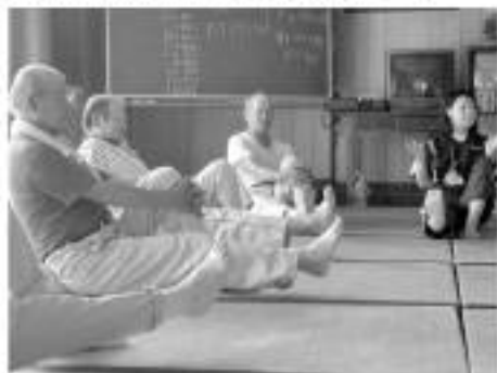
地域の顔なじみと一緒に！