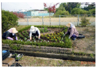
△有明公園花壇整備の様子(花愛グループ)