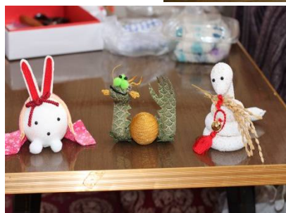
≡ 干支の飾り物 倉掛地区