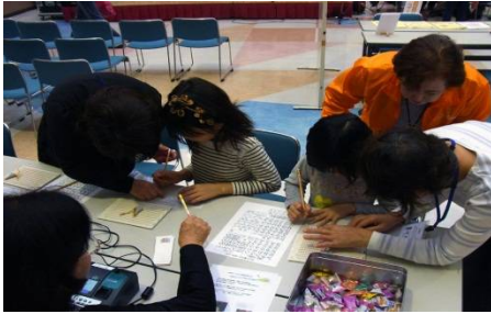
▲こちらは点字体験です。