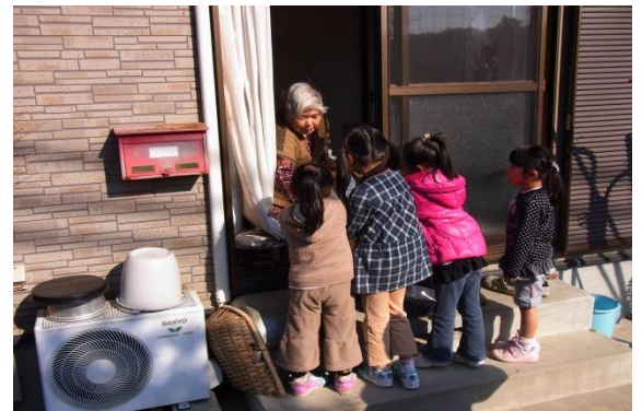
▲お餅をひとり暮らしの方に届けます 助丸地区