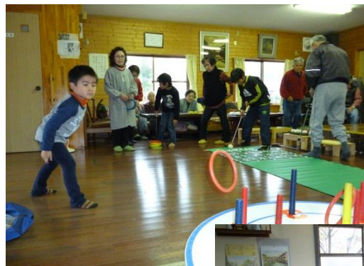
▼認知症予防に 指の運動です。