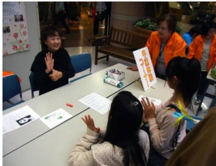
▼子どもさんに手話体験です。