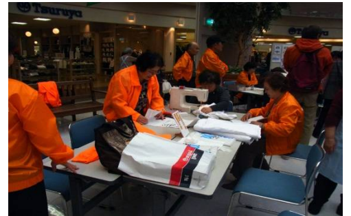
▲おむつの補強や衣服の補修作業です。